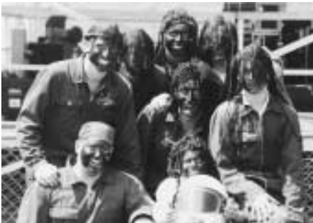
«Cool running», Sieger des Kostümpreises